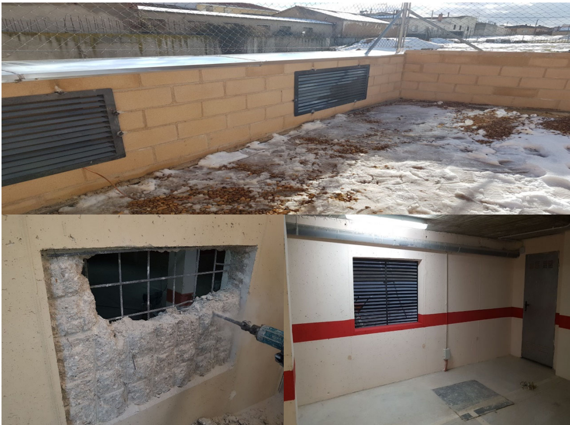
EJECUCIÓN VENTILACIONES NATURALES