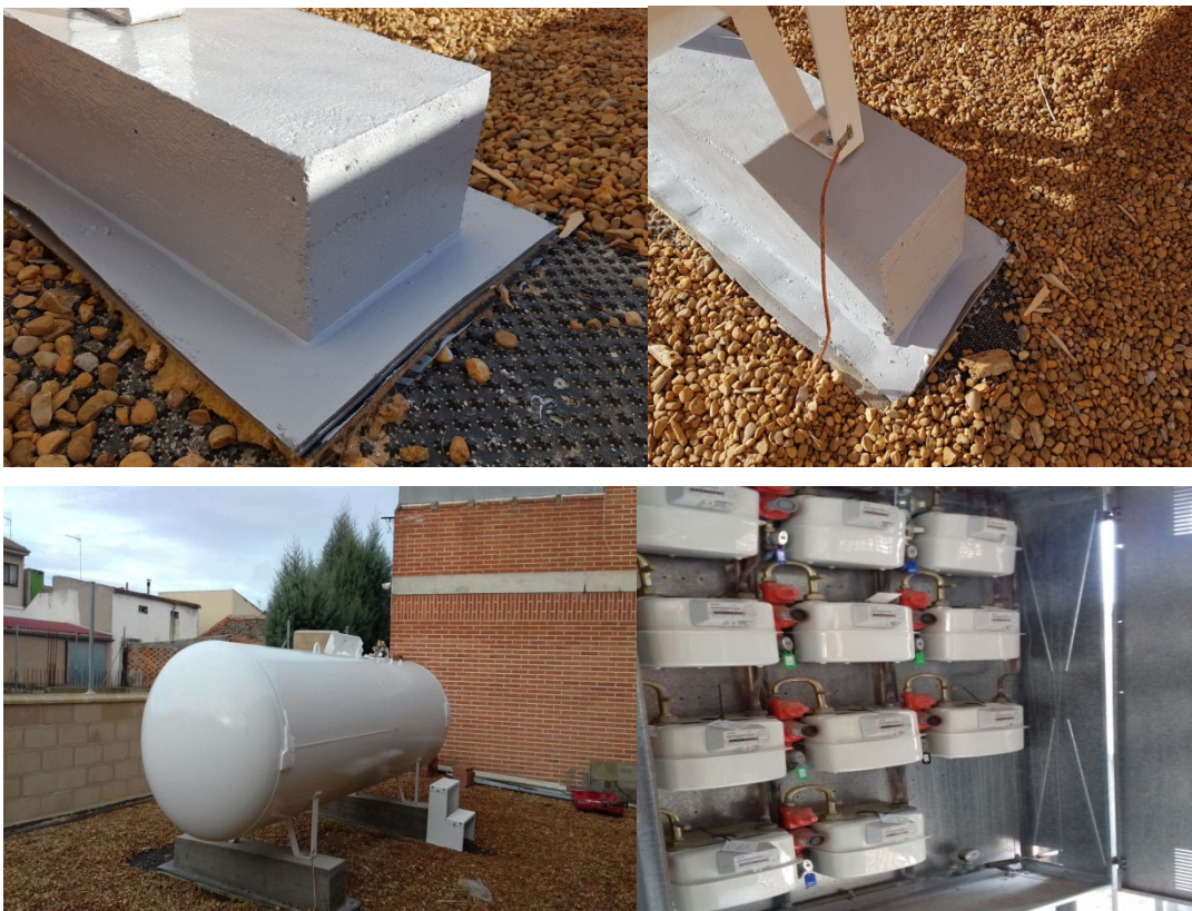
INSTALACIÓN DE DEPÓSITO AÉREO GLP EN PATIO INCLUYENDO INSTALACIÓN CONTADORES